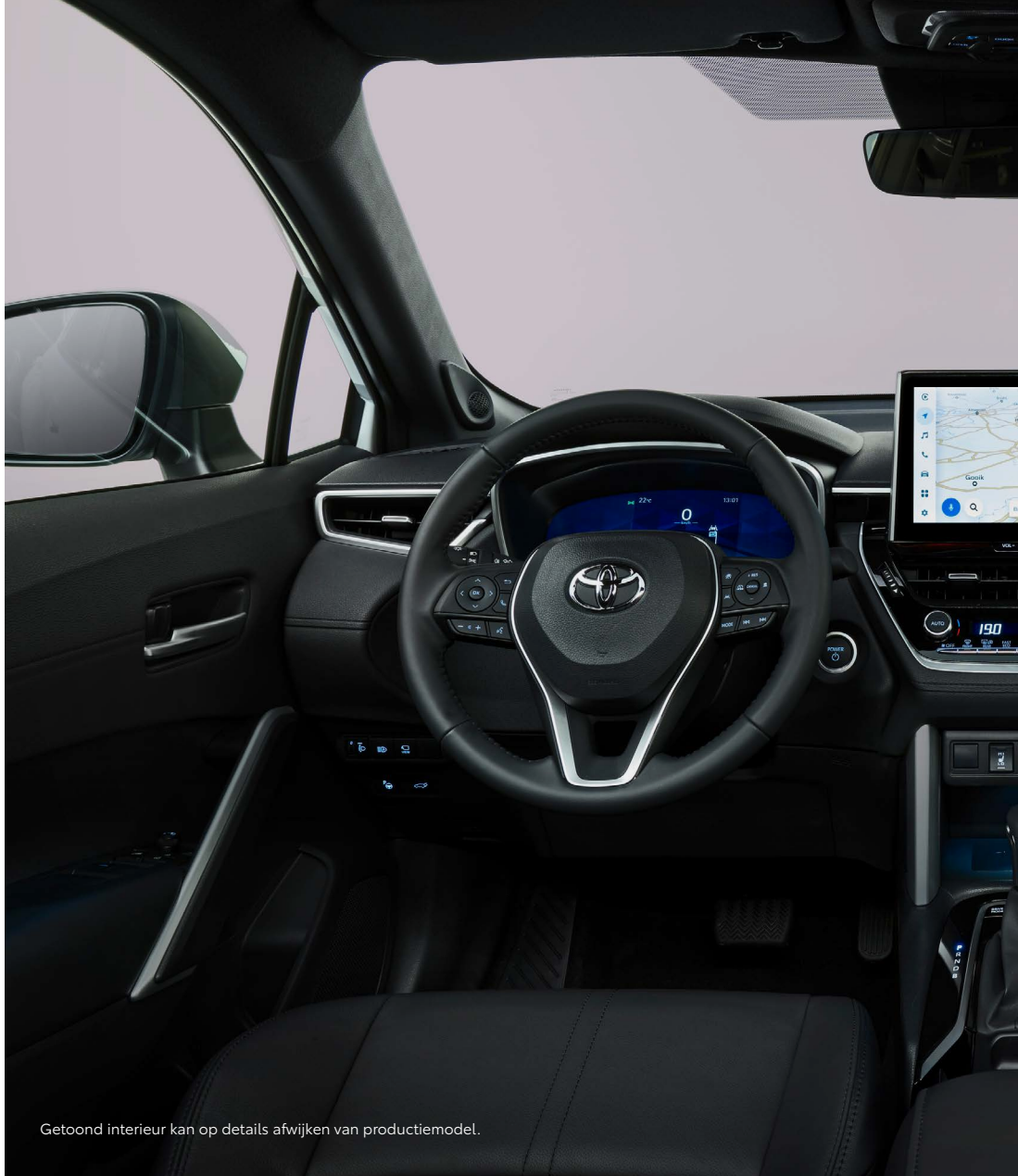
Getoond interieur kan op details afwijken van productiemodel.

Via je smartphone kun je de portieren openen en vergrendelen, de alarmlichten inschakelen en het interieur voor vertrek al op een prettige temperatuur brengen.