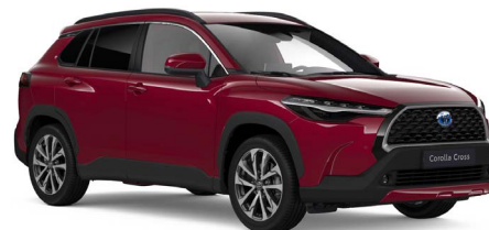
Lava Red parelmoer (3T3)