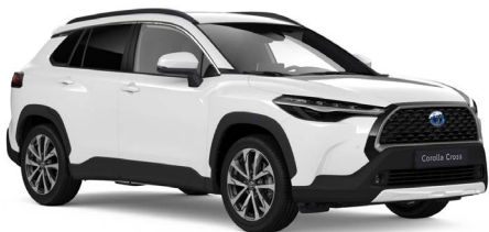
Pure White solid (040)