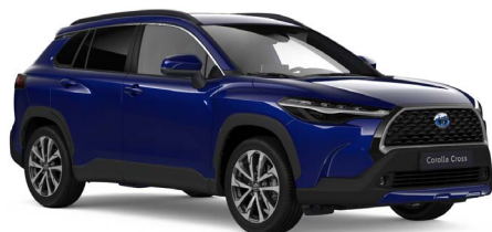
Cobalt Blue metallic (8W7)