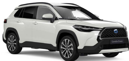
Platinum Pearl White parelmoer (089)