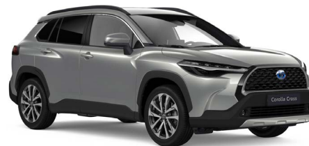
Shimmering Silver metallic (1L0)