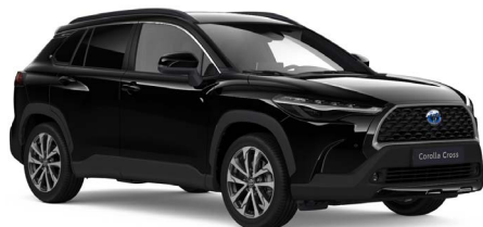
Attitude Black metallic (218)