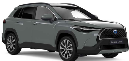
Urban Khaki signaallak (6X3)